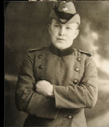
Vor langer Zeit ...