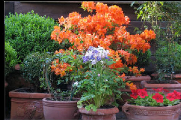
Fantastische Farbenpracht auf der Terrasse ...