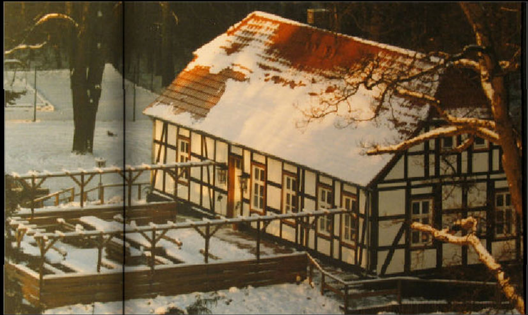
Der erste Winter